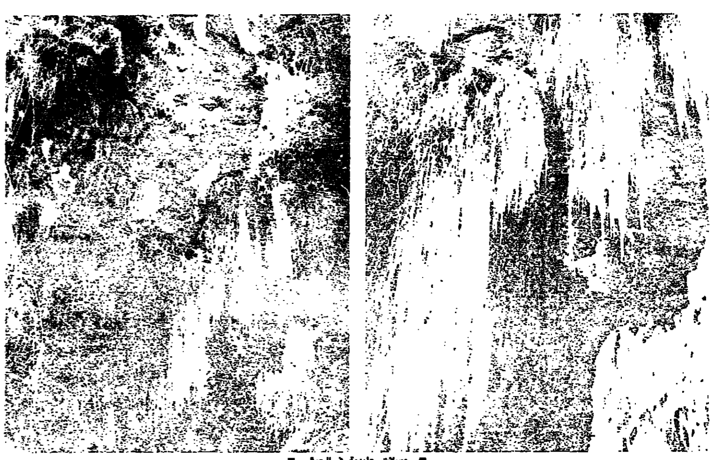
مسائل جليدية في الجبل